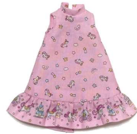
② スタンドカラー ワンピース